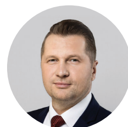
prof. Przemysław Czarnek Minister Edukacji i Nauki