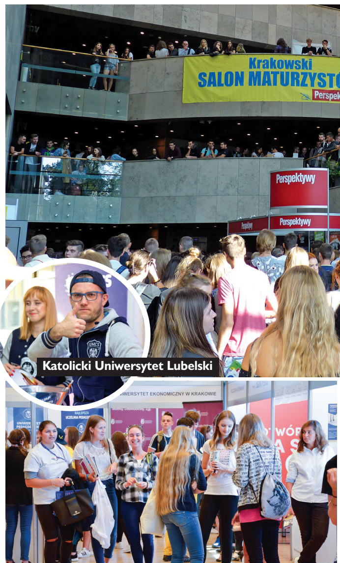
Katolicki Uniwersytet Lubelski